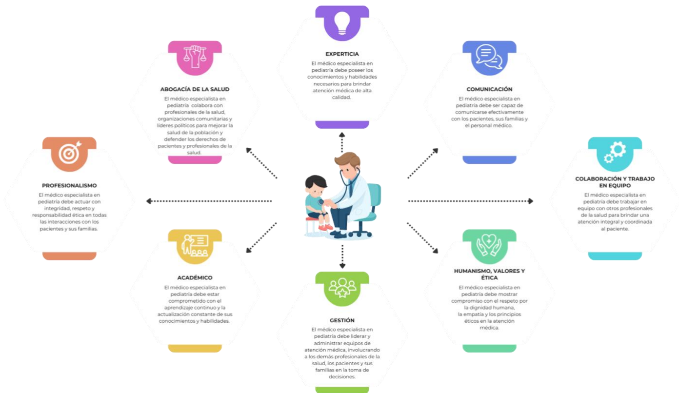
Figura 1. Mapa de Competencias Genéricas

Por su parte, las competencias específicas del pediatra ( Figura 2 ) fueron formuladas a partir de los dominios funcionales del ejercicio profesional del especialista, considerando un enfoque centrado en el paciente pediátrico, su familia y el entorno. Estos dominios se detallan a continuación: