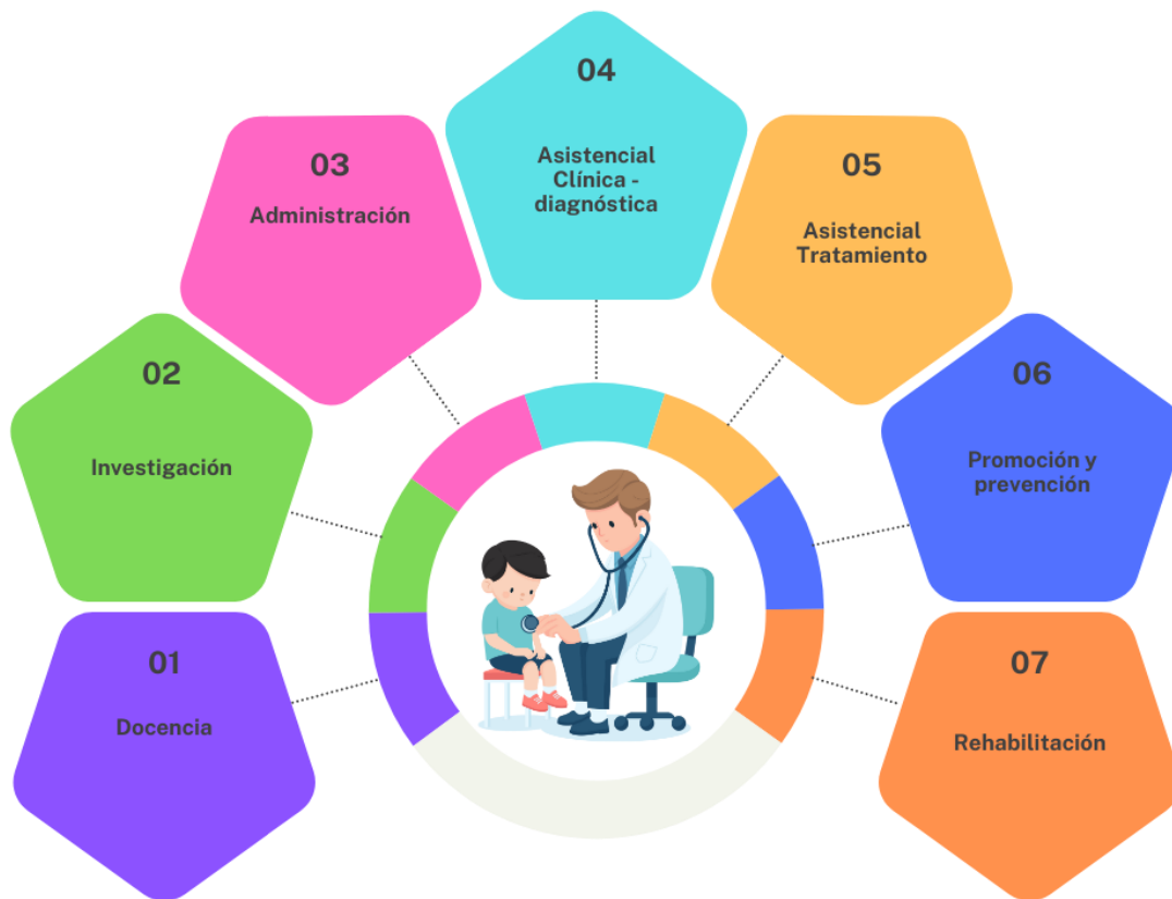
Figura 2. Mapa de Competencias Específicas

Tanto las competencias genéricas como las específicas del programa de Pediatría fueron formuladas a partir de una estructura metodológica que integra enfoques complementarios. Se adoptó la estructura técnica verbo + objeto + propósito + condición de calidad , reconocida internacionalmente por su capacidad para aportar claridad conceptual, coherencia interna y viabilidad evaluativa. Esta estructura facilita su articulación con los Resultados de Aprendizaje Esperados (RAEs) y su incorporación en los procesos curriculares, pedagógicos y de aseguramiento de la calidad.