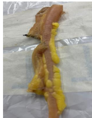
Modelo atresia esofágica con fístula traqueoesofágica distal