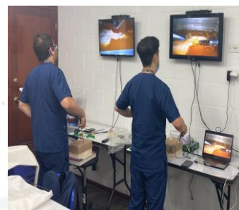
Práctica de los residentes