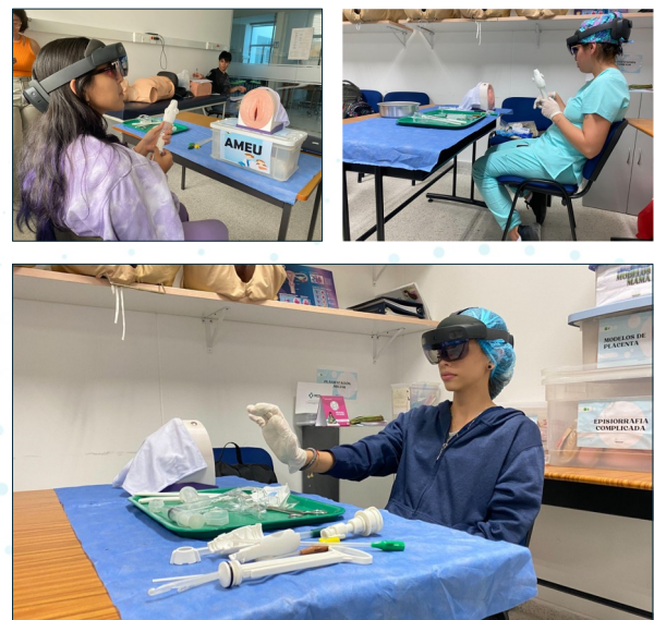
Figura 3. Pruebas con estudiantes de medicina.

La implementación de tecnologías de realidad extendida y simuladores físicos en la enseñanza de procedimientos médicos especializados presenta una oportunidad significativa para mejorar la educación médica. Los resultados de este estudio demuestran que el enfoque integrado propuesto puede superar limitaciones previas en la enseñanza de la AMEU, facilitando una ganancia de aprendizaje notable entre los estudiantes. Este avance no sólo es relevante para la educación médica, sino que también tiene implicaciones potenciales en la práctica clínica, posiblemente mejorando la calidad de la atención ginecológica al equipar a los futuros profesionales con una mejor comprensión y habilidades prácticas más sólidas. Futuras investigaciones podrían explorar la replicabilidad de estos resultados en otros contextos educativos y con procedimientos médicos variados, así como el impacto a largo plazo de este método de entrenamiento en las competencias clínicas de los estudiantes. Este estudio subraya la importancia de incorporar tecnologías avanzadas en la formación médica, sugiriendo que la realidad extendida junto con simulaciones físicas realistas pueden ser herramientas valiosas en el arsenal educativo, potenciando la preparación de los estudiantes para procedimientos complejos y mejorando su competencia y confianza.